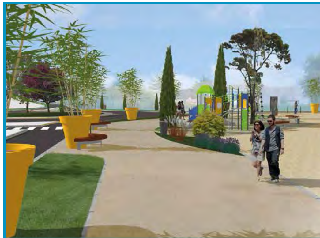
Projection du site réaménagé

Grand Troyes & Ville de Pont-Sainte-Marie